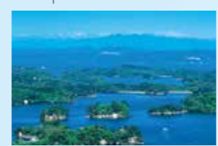
松島 被選為日本三景之一的風景名勝。擁有四季各異其趣的美景，以及許多歷史深遠的景點。