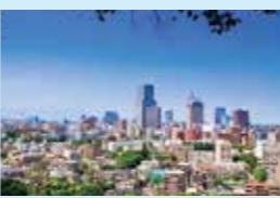
仙台 東北地方規模最大的中心城市。四周環繞著豐富的自然綠意，巧妙融合傳統文化與近代風景的美麗城鎮。