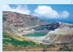
宮城藏王 冬天有冬季運動、夏季與秋季可觀察大自然等，是相當受歡迎的度假村地區。